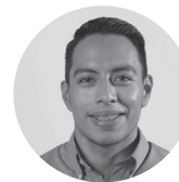
Por: Juan Emilio García

Navidad para todos es una campaña en la que nuestros colaboradores pueden donar su tiempo, talento o tesoro con motivo de la temporada navideña a personas de escasos recursos.